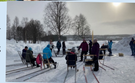
Bilder från Integrationservice aktiviteter.