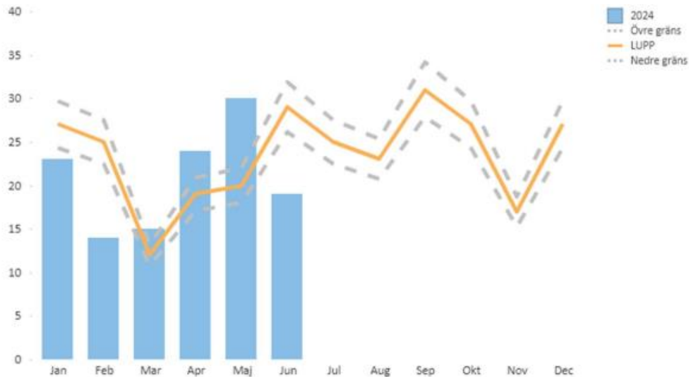
Totalt inkomna polisanmälningar per månad i jämförelse med LUPP 7

Antal ärenden är 17. Ett ärende kan generera fler brott beroende på ärendet.