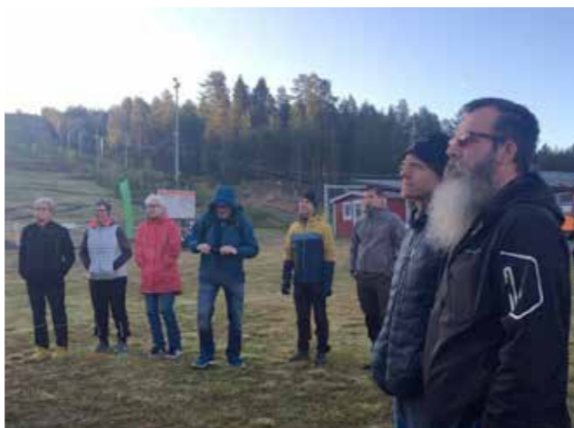
Intresserade företagare tog del av informationen vid Gomorron Malå.