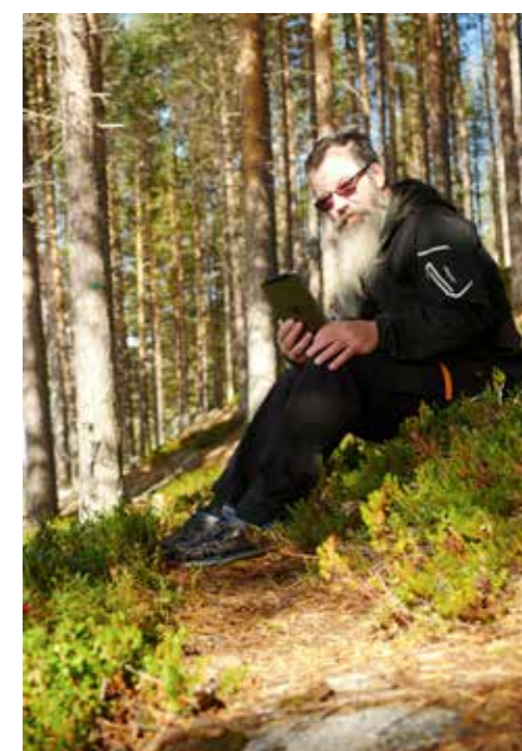
En paus för att dokumentera dagens vandring.

– Ja faktiskt. De jag började gå med i våras är utnötta så det är dags att uppgradera.