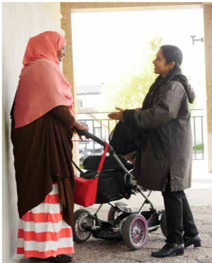
bild och bygga förtroende. Hur länge det tar för dem att landa är förstås individuellt. Men här kan de känna sig trygga.

vi en bredare diskussion för att få en klar