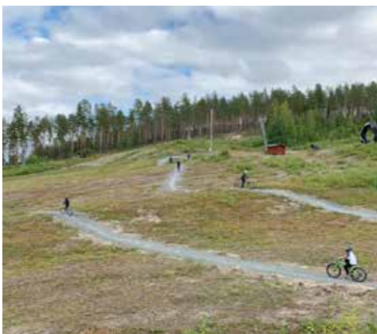
Hitintills har fyra banor anlagts av frivilliga krafter.