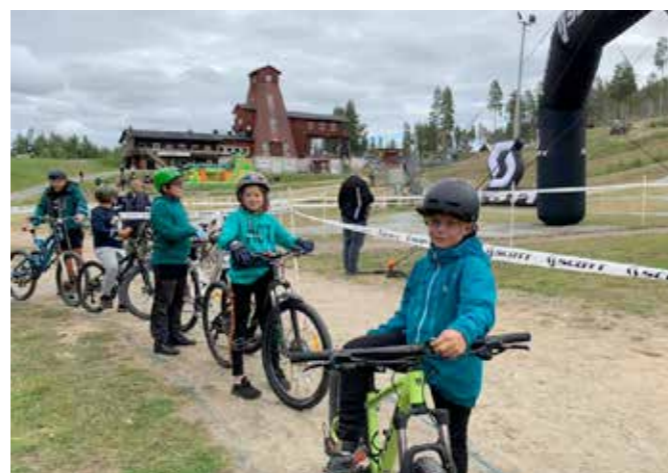
Många barn och vuxna har fått en ny spännande fritidssysselsättning.