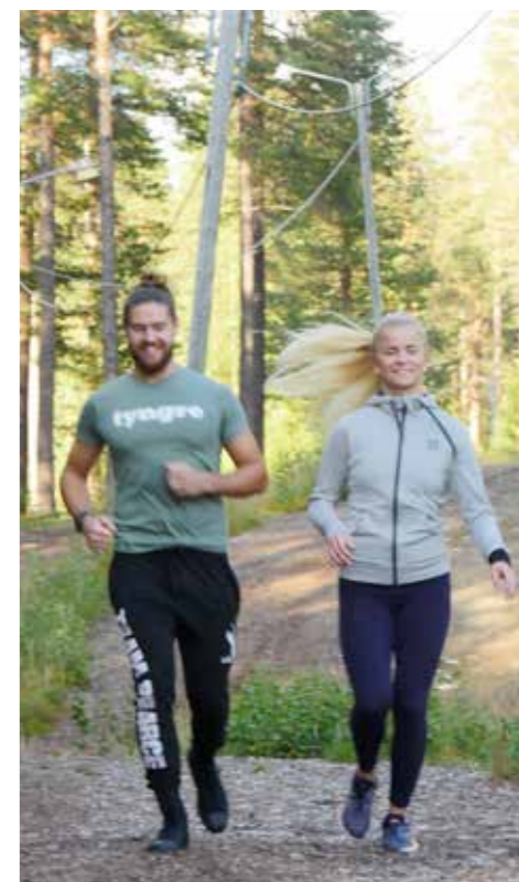
Att få träna tillsammans ger alltid en extra kick.

– I Australien får man inte heller allt serverat på silverfat. Det har vi fått lära oss.