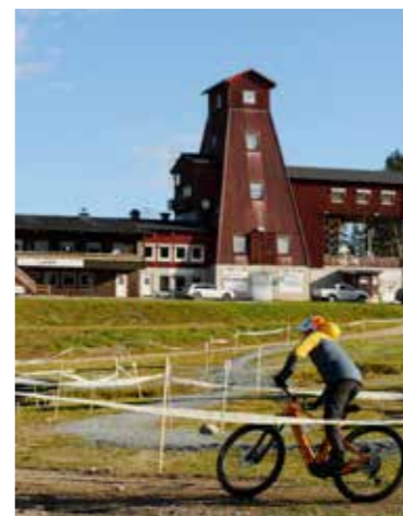
Bansluten med Laven som blickfång.