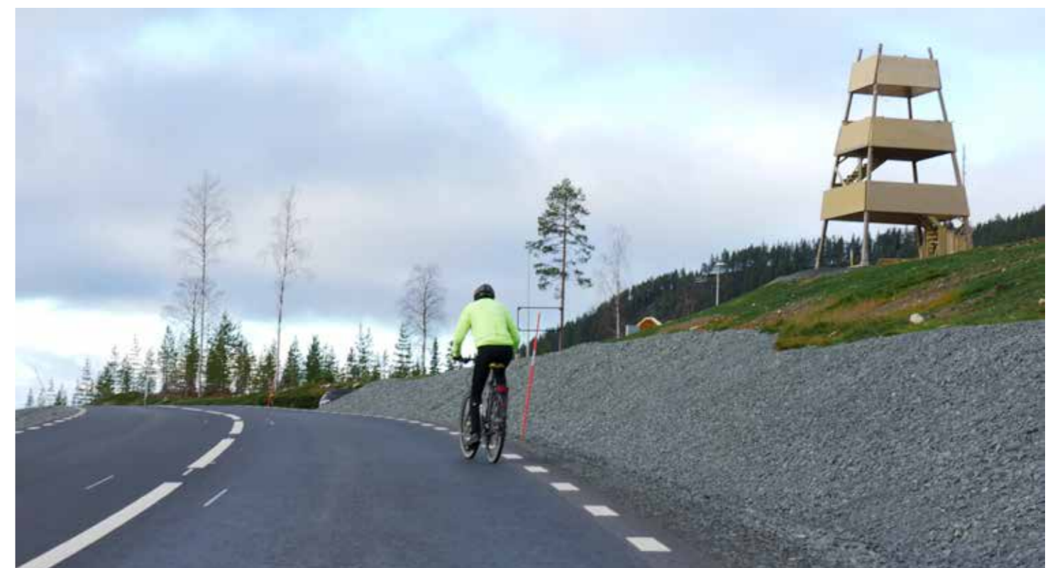
Utsiktstornet vid infarten till Malå blir en "info-point" där passerande kan stanna till, njuta av den fantastiska utsikten och ta del av information om allt det som gör bygden så unik, natur, fågel- och djurliv, mineral, näringsliv, samekultur och service. En större digital infotavla och flera djurfigurer i trä ska också pryda platsen.