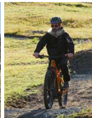
Även "Tomten" åkte utför Tjamstan.