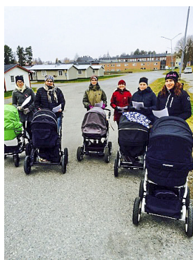
Malås unga framtid i vagnarna med sina mammor ute på dialogrundan