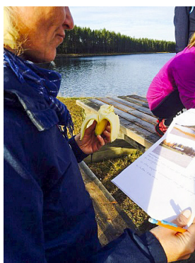
Vad ska vi göra med Nölviken när den nya cykelvägen anläggs?

Enligt tidplanen ska ett arbetsmaterial finnas klart för samråd hösten 2017.