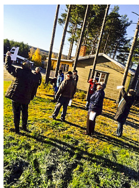
Hela Tjamstanområdet drivs nu av kommunen. Framtida satsningar?