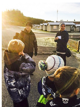
Nilaskolans elever och lärare tog chansen att ge synpunkter