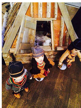
Miniatyrer av skogssamisk kåta och dockor i Malådräkter