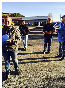
Diskussioner kring hur torget ska utformas de närmaste åren