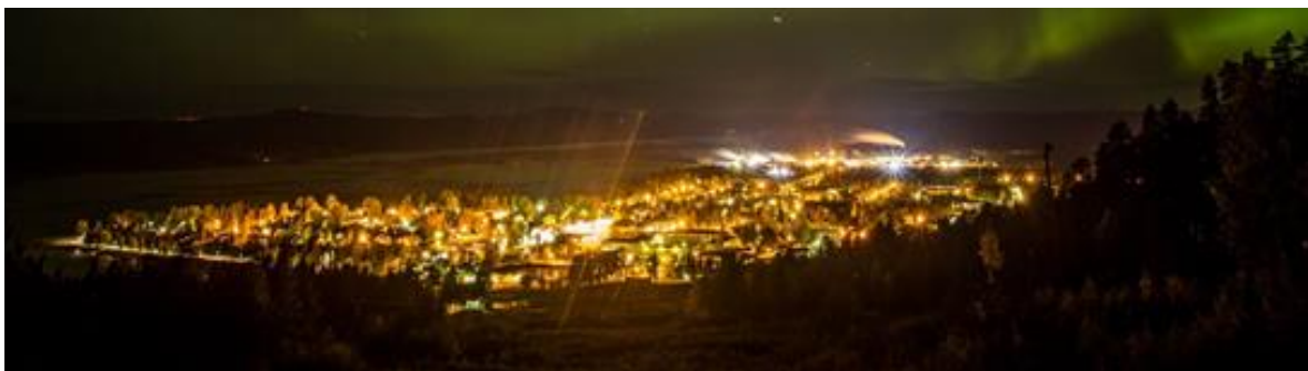
Malå samhälle, Foto: www.ricke.se

Arbetsmarknad, Utbildning, Bostäder, Stanna eller återvända