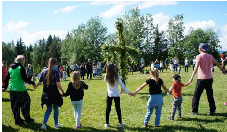
Midsommarfirande 2019, Släpträskbrännan

Samhällsorientering, Hälsa, Hedersrelaterad våld och förtryck och Jämställdhet