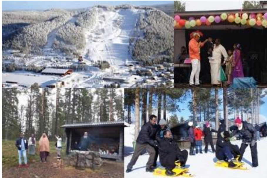
60-talsveckan 2016, Sjørundan 2020 i Laggräsket och SFI-elever i Tjamstanbackarna 2013